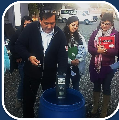
Demostración de uso CTD.