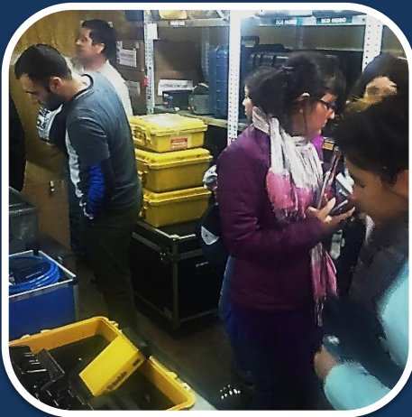
Instrumentos oceanográficos e hidrográficos.